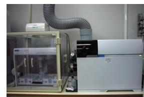
ICP 質量分析装置 (アジレント・テクノロジー製 7900 ICP-MS)

※ICP (Inductively Coupled Plasma) は誘導結合プラズマの意味で、測定時の光源やイオン化源として利用しています。