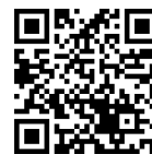
参加申込フォーム