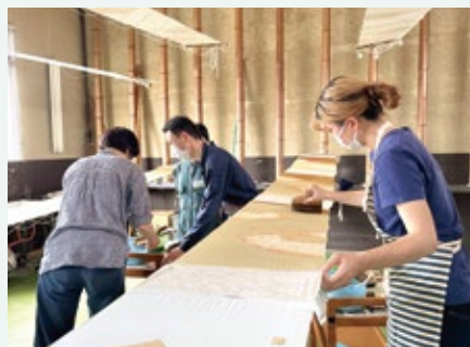
▲ 引染工程 実習風景 (外部)