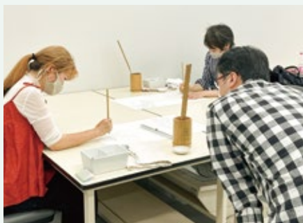
▲ 下絵工程 実習風景