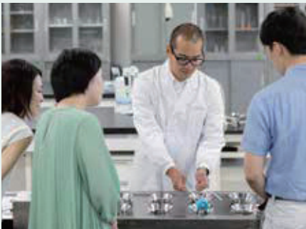
▲ 染色試験による浸染実習