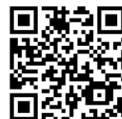
参加申込フォーム