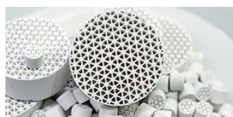
セラミックス用バインダー