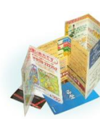
ダイレクトメール用接着剤