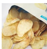
食品包装用 PET フィルム加工剤