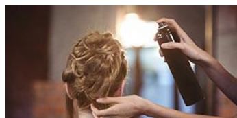
ヘアセット用樹脂