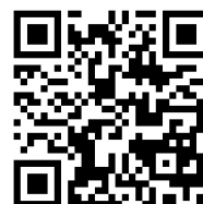
記念講演申込フォーム