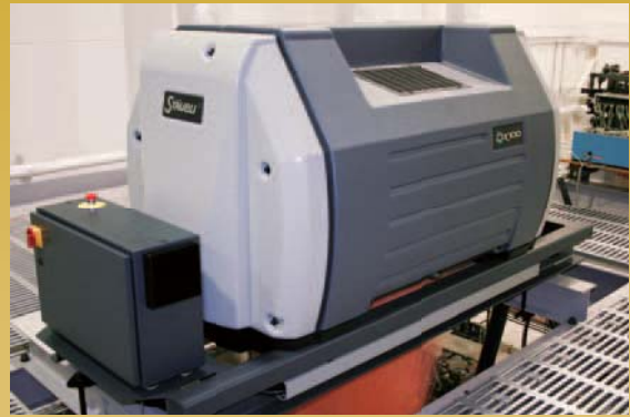
ストーブリ社製電子ジャカード (2688口)