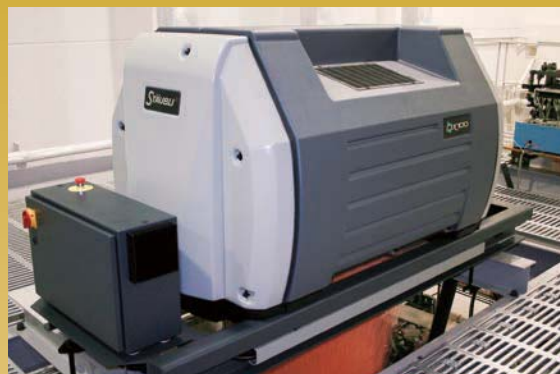
ストーブリ社製電子ジャカード (2688口)