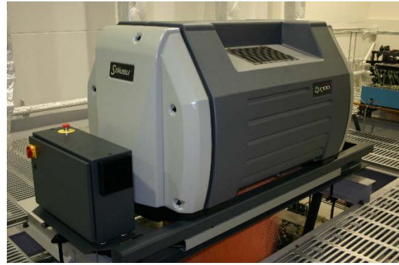
ストーブリ社製電子ジャカード(2688口)