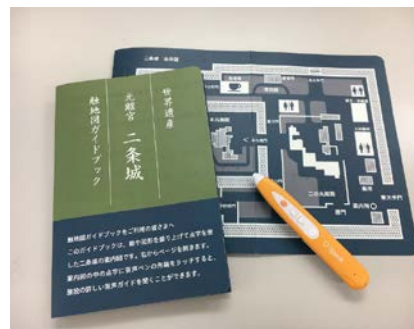
触地図と音声タッチペン(全体図)

御利用の際は、二条城事務所に、事前に御連絡いただくか、直接お越しください(無料。15セット)。